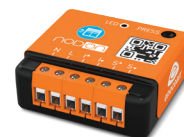
Module Volets Roulants SIN-2-RS-XX