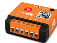
Module Encastré 1 Canal Contact Sec SIN-2-1-XX