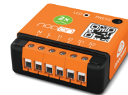
Module Encastré 2 Canaux SIN-2-2-XX